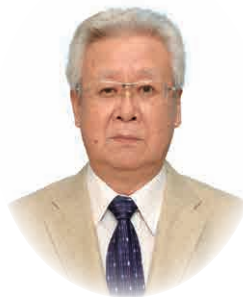
社会福祉法人 行橋市社会福祉協議会